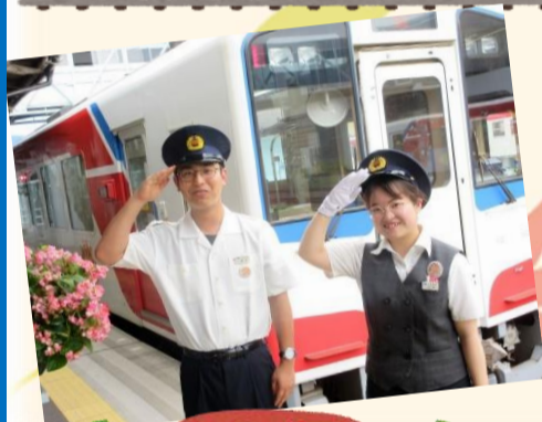
卒業生のお二方、三陸鉄道のみなさま ご協力ありがとうございました!(^^)!

気持ちにゆとりを持ちながら、基礎知識を身につけ、志望校合格に向けてしっかりと勉強を頑張ってください!